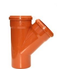
PVC Kanalrohr Abzweiger, NW 100/100, 45°