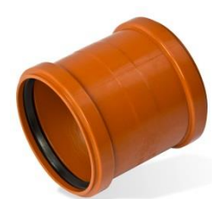
Überschiebmuffe, NW 110 mm