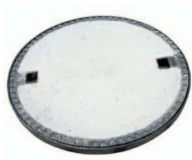
BEGU Deckel, Ø 50 cm, befahrbar