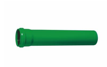
PP Kanalisationsrohr grün, NW 110 mm