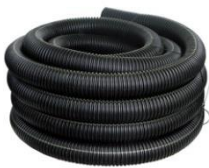
Drainflex Sickerrohr Schwarz, NW 80 mm