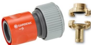
Gardena Kupplung / GEKA Kupplung