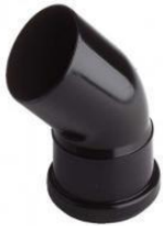
PE Kanalrohr Bogen 45° NW 150 mm