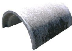
Beton Halbschale, Ø 50 cm, BL 50 cm