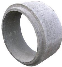
Betonrohr ohne Boden, Ø 40 cm, BL 10 cm