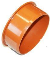
PVC Deckel, NW 125 mm