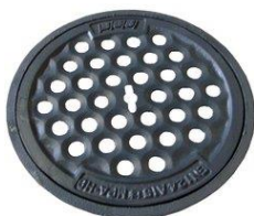
Gussdeckel mit Ring gelocht, Ø 40 cm, befahrbar