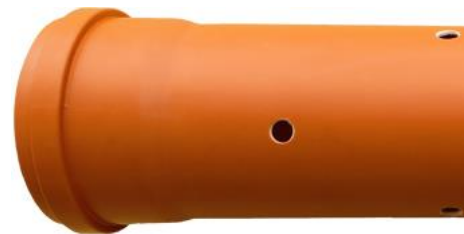
PVC Sickerrohr, NW 125 mm