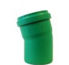
PP Kanalrohr Bogen 15° NW 110mm