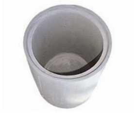
Betonrohr mit Boden, Ø 30 cm, BL 50 cm