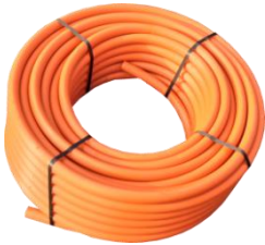
Kabelschutzrohr orange DN 30 mm