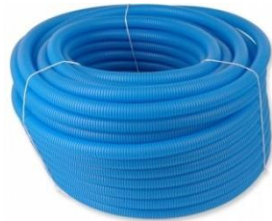
Kabelschutzrohr flexibel, DN 20/25/30 mm