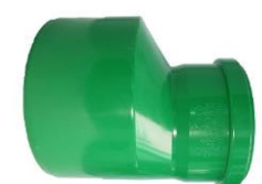
PP Reduktion NW 125/110 mm